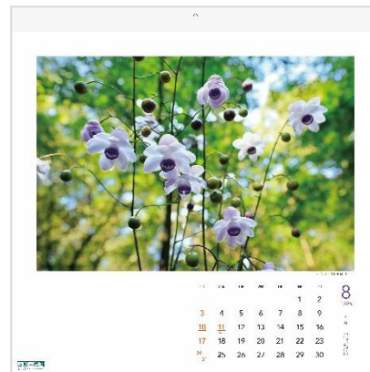
8月：レンゲシヨウマ