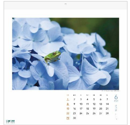
6月：「秘密基地からこんにちは」 (フォトコンテスト2019受賞作品 うゑちるさん)