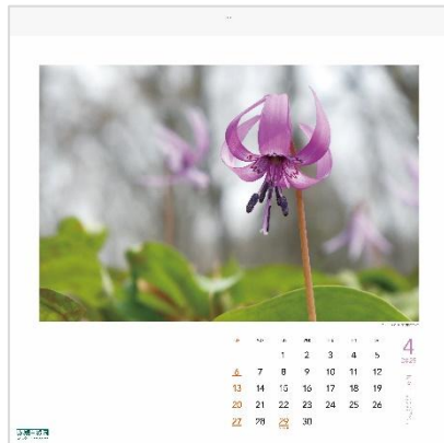
4月：カタクリ (赤城自然園スタッフ)