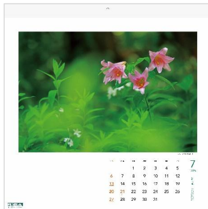
7月：ヒメサユリ