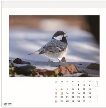
1月：「真冬の給水」