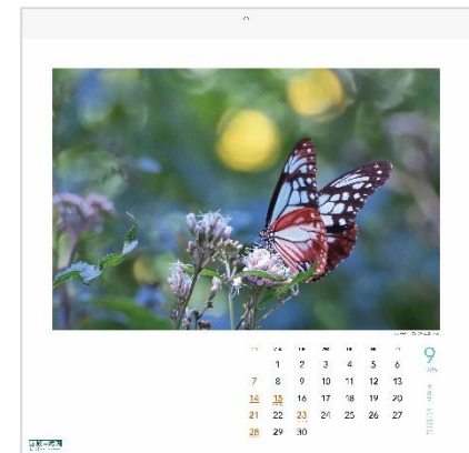
9月：アサギマダラ (赤城自然園スタッフ)