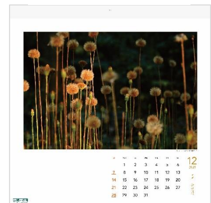
12月：センボンヤリ (赤城自然園スタッフ)