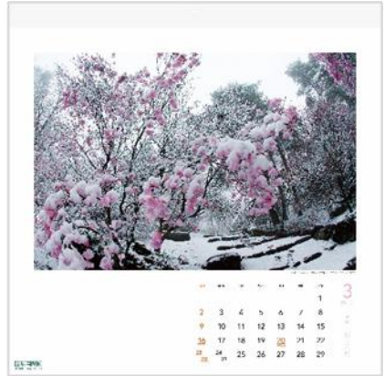
3月：「雪とアカヤシオ」 (フォトコンテスト2015受賞作品 大晶繁さん)