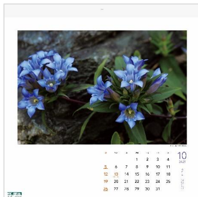
10月：リンドウ