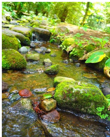
クレディセゾン社長賞